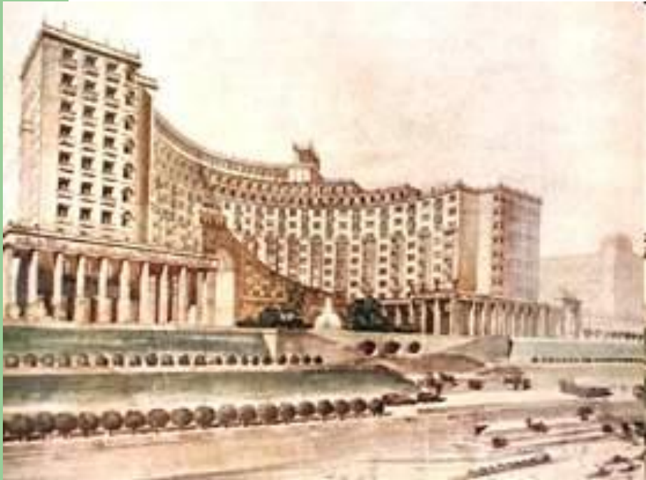
Проект ансамблевой застройки Ростовской набережной

Авторы акад. арх. А. В. Щусев и арх. А. К. Ростковски