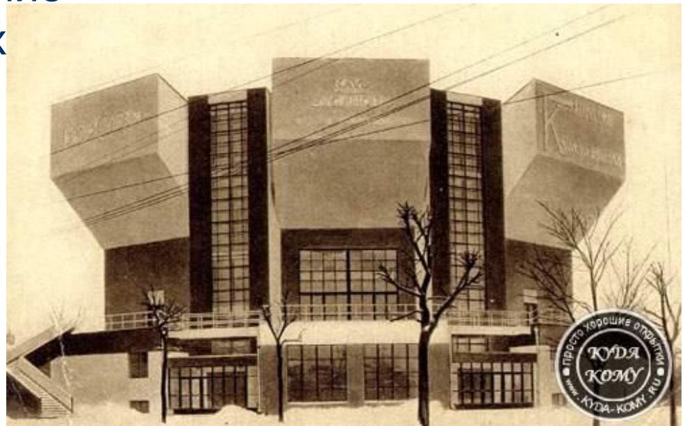
Мельников. Клуб профсоюза коммунальщиков

Конструктивизм — направление в советском искусстве 20-х гг., выдвинувшее задачу художественного конструирования материальной среды, окружающей человека: интерьера, мебели, посуды, одежды и т. п.