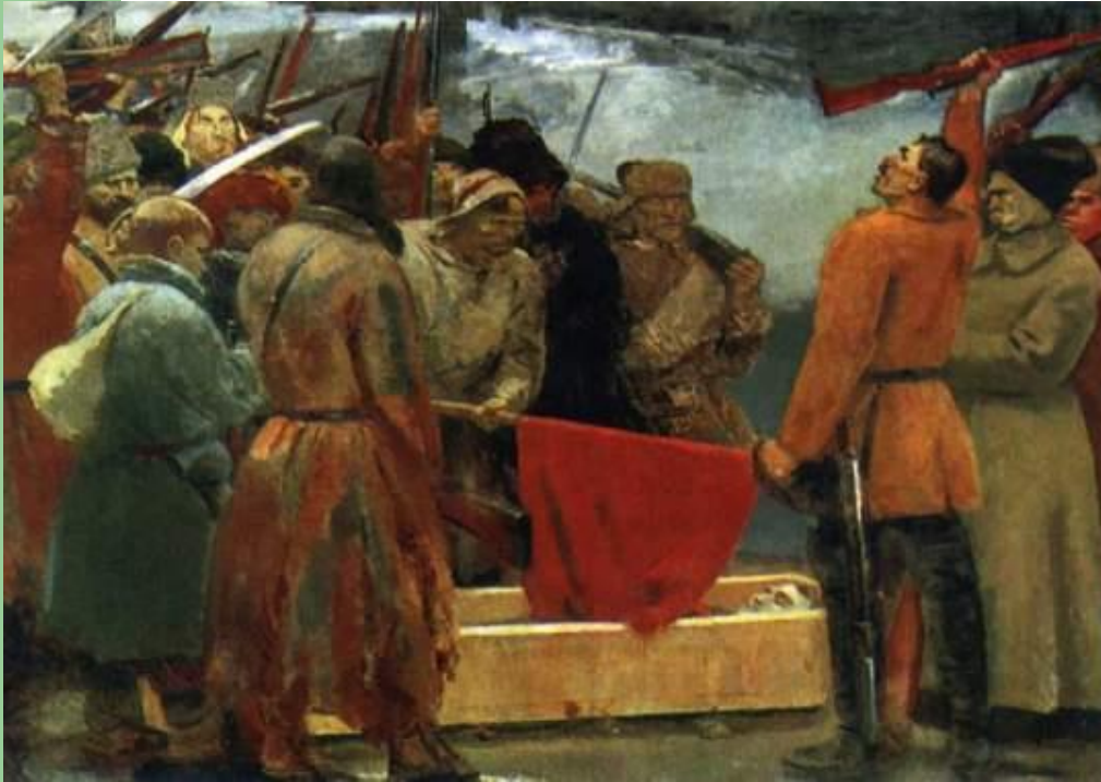
Клятва сибирских партизан. 1933г.