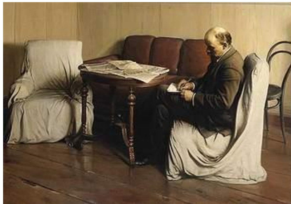
И. И. Бродский, «В. И. Ленин в Смольном в 1917 году», 1930

крупное объединение советских художников, графиков и скульпторов, являвшееся благодаря поддержке идеологической линии государства, самой многочисленной и мощной из творческих группировок 1920-х годов. (1932-1932 гг)