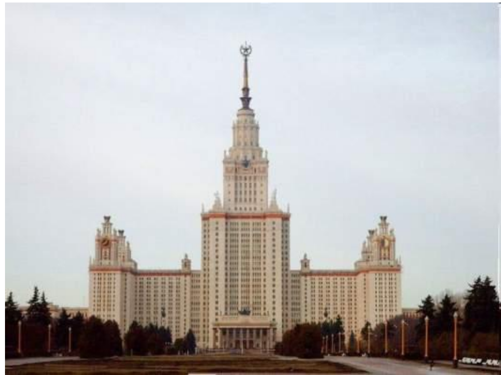
Главное Здание МГУ