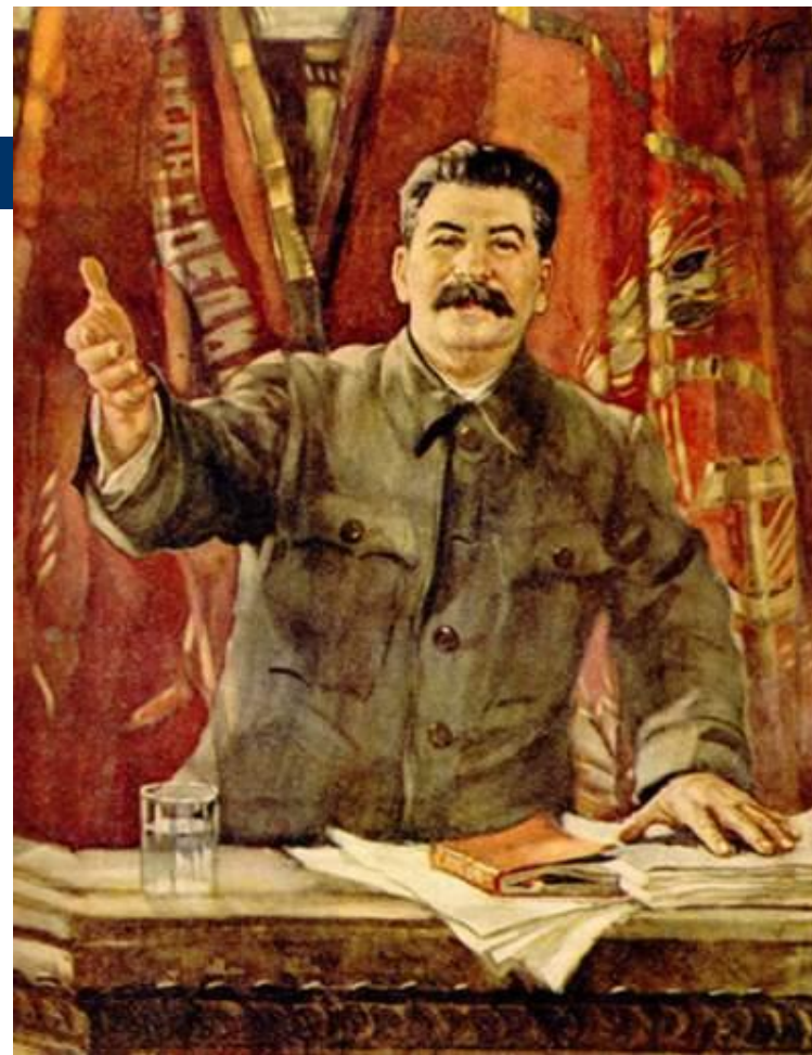
А.М. Герасимов. И.В. Сталин делает отчетный доклад на XVIII съезде ВКП(б) о работе ЦК ВКП(б). 1939. ГТГ