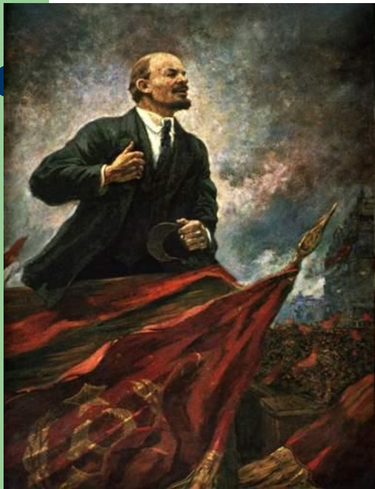
А.М. Герасимов. В.И. Ленин на трибуне.