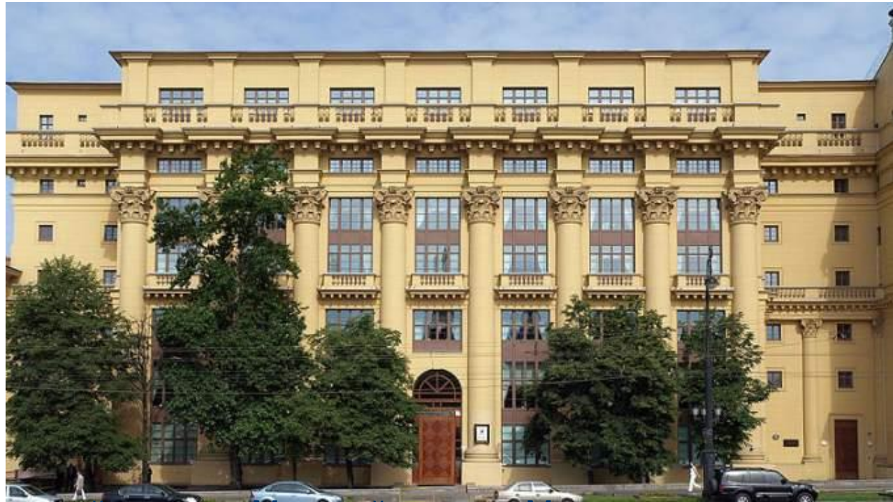
жилой доме на Моховой улице в Москве (1934 г., архитектор И. В. Жолтовский).

В интерпретации некоторых талантливых мастеров исторические формы получали глубоко своеобразное и подлинно художественное претворение.