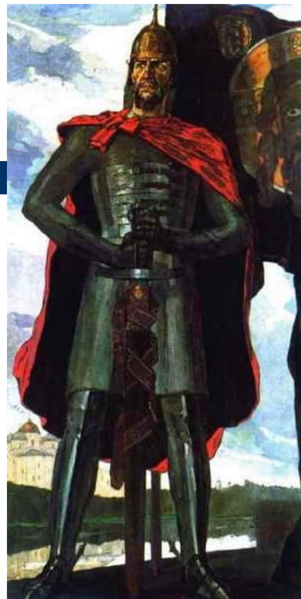
П. Корин. Александр Невский