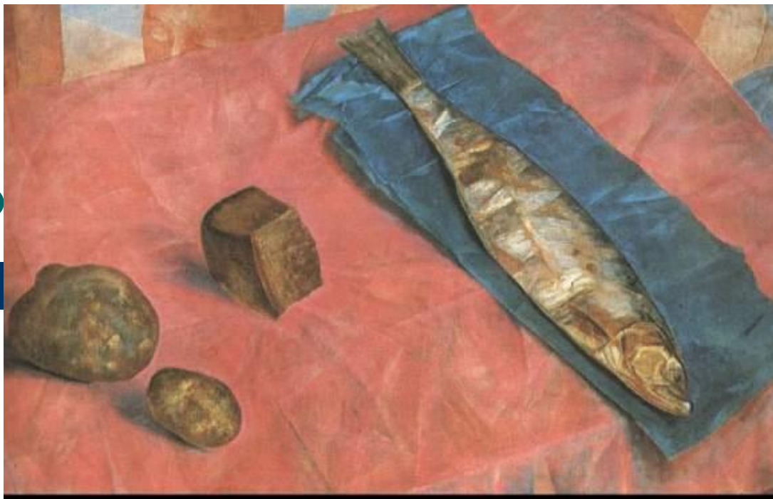
Петров-Водкин «Селедка», 1918