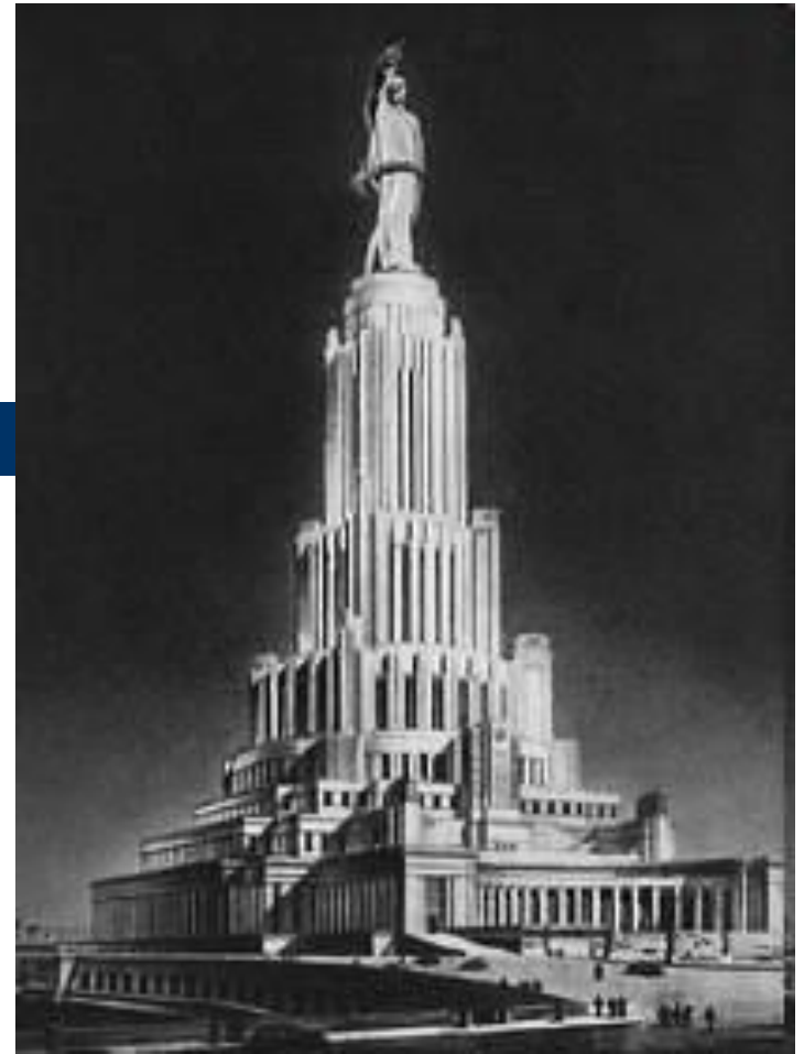
Проект Дворца Советов Авторы: Б. М. Иофан, акад. В. А. Щуко, проф. В. Г. Гельфрейх

Авторы акад. арх. А. В. Щусев и арх. А. К. Ростковски