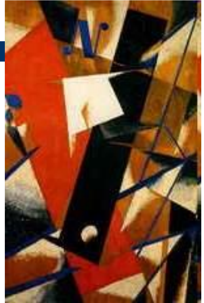
Попова Л. С. Пространственно-силовая конструкция. 1921