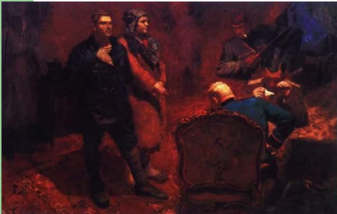
Б. Иогансон Допрос коммунистов. 1933г.