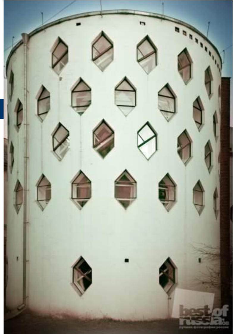
Дом-музей архитектора Мельникова

В 1923 г. возникла Ассоциация новых архитекторов (АСНОВА), виднейшими представителями которой были Н. А. Ладовский, К. С. Мельников. В 1925 г. создано Объединение современных архитекторов (ОСА) — их называли конструктивистами