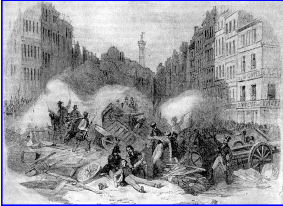
Баррикадные бои в Париже