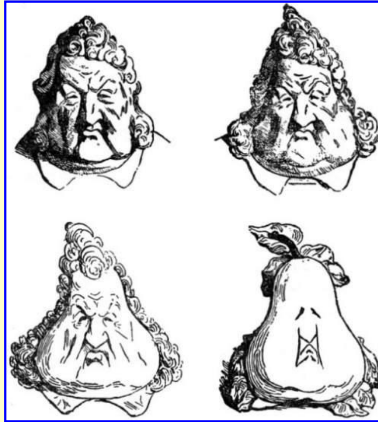
Карикатура на Луи Филиппа «Король- груша»

Подъем экономики не повлиял на тяжелую жизнь рабочих. Многие промышленники были недовольны правлением Луи Филиппа, т.к. он поддерживал финансовую буржуазию. В стране (в основном в Париже) стали возникать тайные республиканские общества.