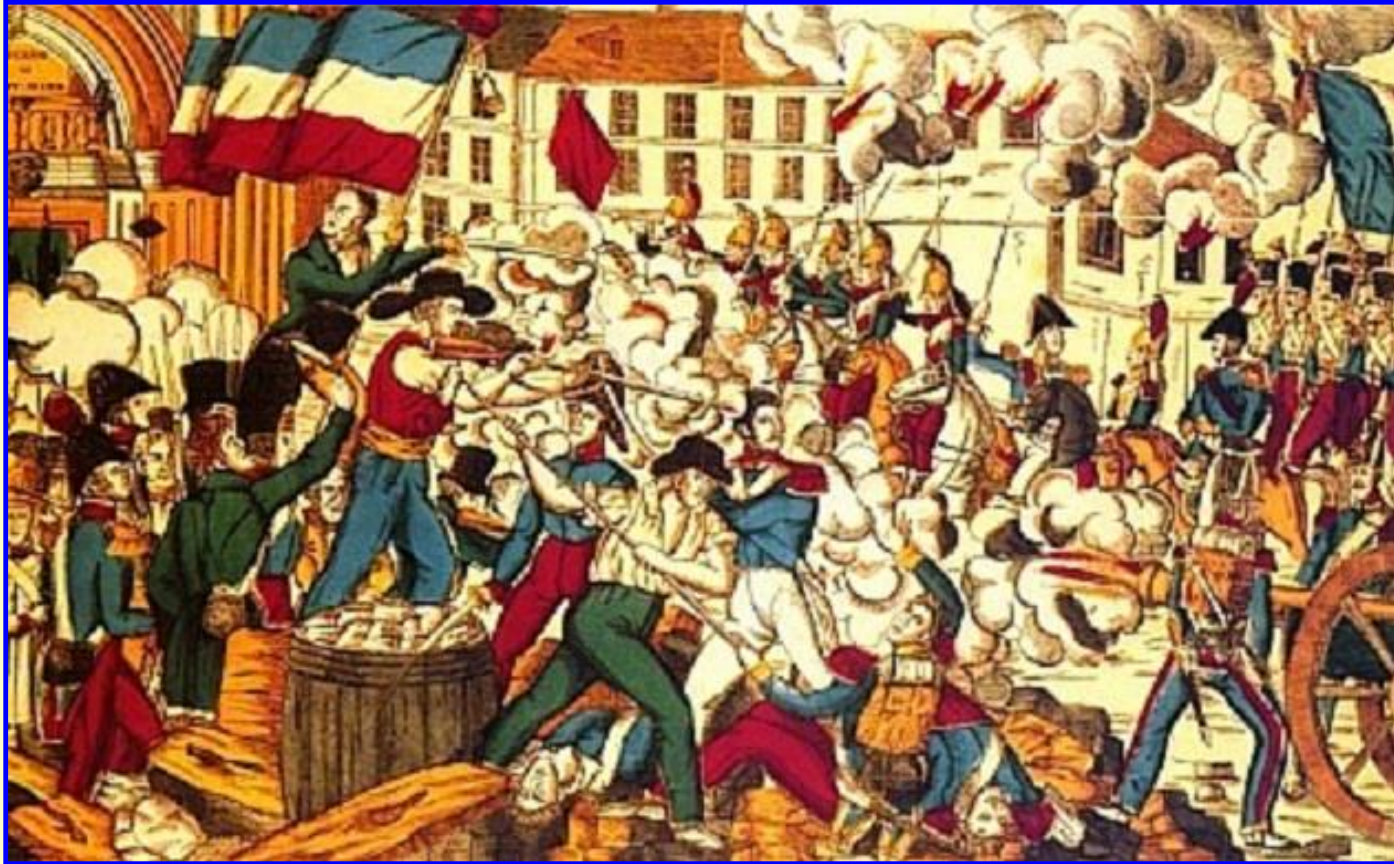
Восстание лионских ткачей

В 1830-е гг. возросло число стачек, иногда они перерастали в волнения и восстания. Крупные восстания рабочих-ткачей происходили в Лионе в 1831 и 1834 гг. Восстания жестоко подавлялись с помощью армии. В апреле 1834 г. волнения начались в Париже.