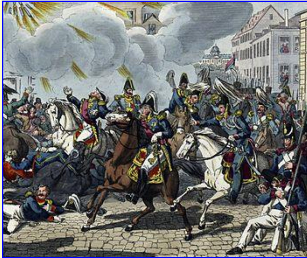
Покушение на Луи Филиппа

К середине 1840-х гг. во Франции начался социальный и экономический кризис. Безработных становилось все больше, росли цены, в 1845-1847 страну постигли неурожаи. Авторитет «народного короля» падал. На него было совершено более 10 покушений.