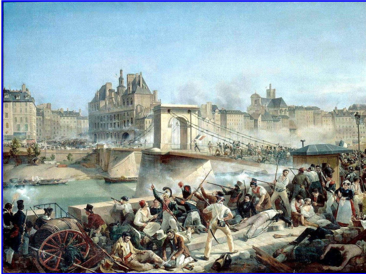
Уличные бои в Париже

В Париже начались демонстрации протеста, которые 27-29 июля 1830 г. переросли в ожесточенные уличные бои. Восставшие захватили городскую ратушу и королевский дворец Тюильри. Карл X с семьей бежал в Англию.