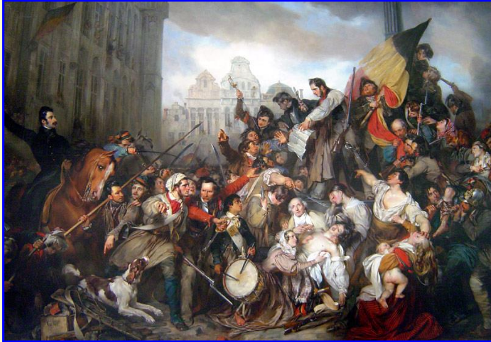
Восстание в Бельгии

С приходом к власти Луи Филиппа в стране окончательно утвердились капиталистические отношения. По поправкам в конституцию 1830 г. были снижены выборные цензы и число избирателей выросло почти в 2 раза (до 250 тыс.чел). Отголоски июльской революции прокатились по всей Европе: восстание против власти голландцев в Бельгии, восстания в Италии и Польше.